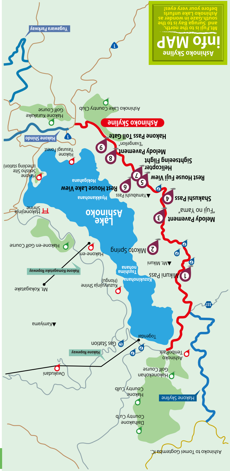
Ashinoko to Tomel Gogemba I.C.